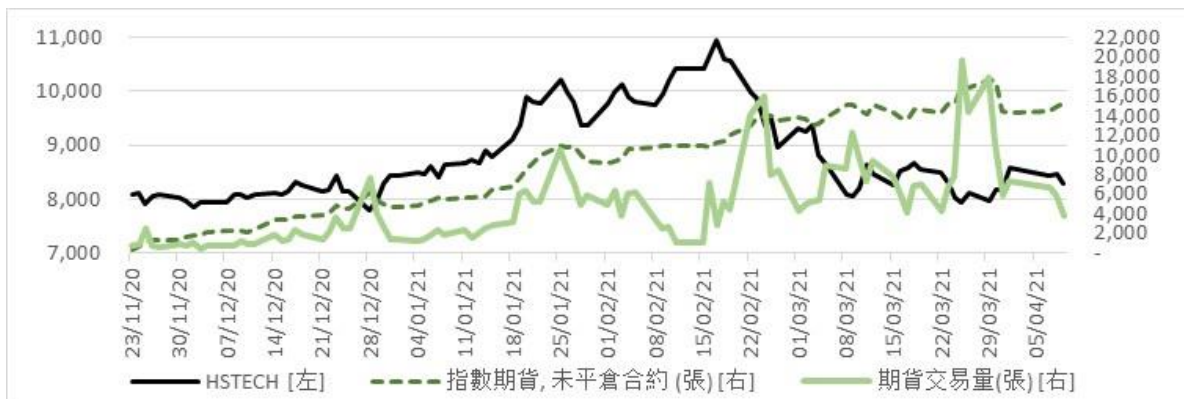
圖 2：恒生科指——期貨交投量及未平倉合約總數

由於恒生科指的表現相對優於大市，其回報波幅亦理應相對較高。香港交易所（「港交所」）早前推出的恒生科指期貨及期權產品，或有助投資者管理涉及恒生科指的投資組合之風險。從圖 2 中可見，自恒生科指期貨於 2020 年 11 月推出以來，其每日交投量曾於 2021 年 3 月 25 日一度大幅飆升至最高水平為 19,723 張。雖然恒生科指期權於 2021 年 1 月底才推出，但如圖 3 及圖 4 所示，其每日交投量及未平倉合約總數分別快速攀升至 1,953 張（2021 年 3 月 18 日）及 7,299 張（2021 年 3 月 30 日）的高峰。