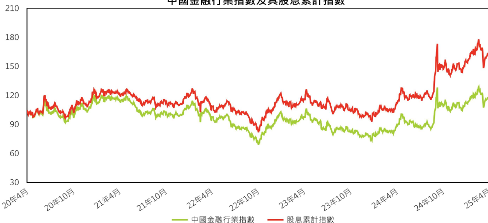
中國金融行業指數及其股息累計指數

以上數據以100.00為基準重新計算。所有於指數發佈日之前的相關資訊均透過回溯測試計算，回溯測試表現僅反映假設性歷史表現。